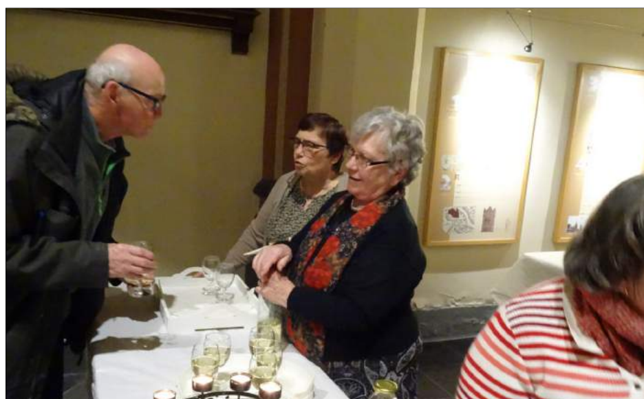
Na de viering was iedereen in de kerk welkom voor een feestelijke receptie.