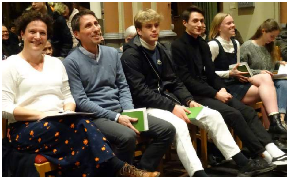
Het gezin van Lien kwam om haar te tonen dat ze haar keuze steunen en aanmoedigen.