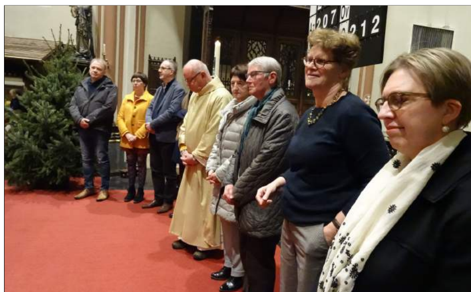
Alle leden van de stuurgroep waren getuigen bij de aanstelling.