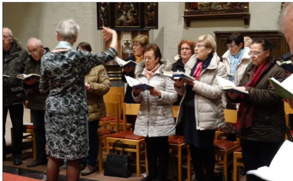
Het parochiaal koor wakkerde de aanwezigen aan om mee te zingen.