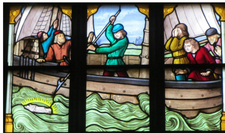
Glasraam in de kerk.