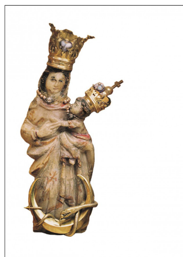
Het miraculeus beeldje.