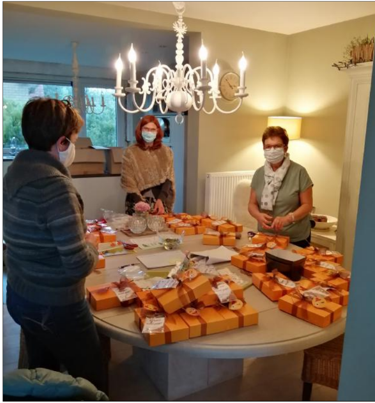
Knutselen met de catechisten