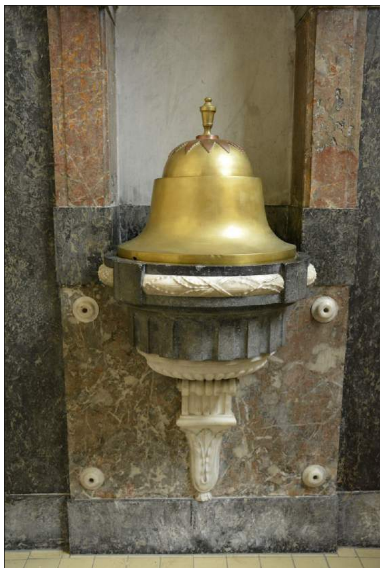
Doopvont Heilige Kruisverheffing

Het geheel is heel sober en streng uitgevoerd, eigen aan het terugkeren naar de klassieke tijd. Meest opvallend is het gebruik van zestinten marmer . Erfgoed Brugge beschrijft dit kunstobject (nr. PW-V.0710.0363) als volgt: "De zwart marmeren wand, bovenaan met een rondboog, heeft een plint in grijze marmer. Het geheel heeft een middenrisaliet (vooruit-springend gedeelte, n.v.d.r.) in rood marmer en bestaat uit een nis met halfronde boog. Ter hoogte van de aanzet van de zwarte en rode bogen is er een wit marmeren uitkraging. De rode boog heeft een gegroefde wit marmeren kraagsteen. Het eigenlijke vont is in zwart marmer, versierd met triglifien, steunend op een wit marmeren voetstuk met knormotief, steunend op een console eindigend in een acanthusblad. De rand van het bekken is versierd met een witmarmeren krans van samenge-