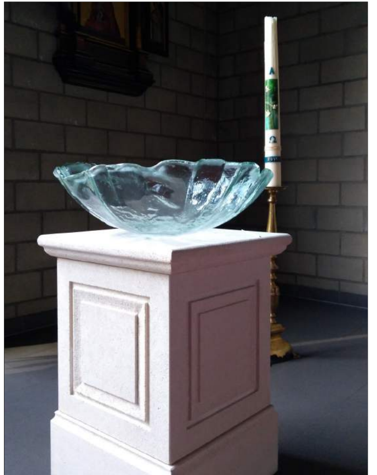
Doopvont Sint-Thomas van Kantelberg