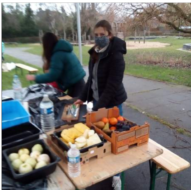
De medewerkers staan klaar om de gezonde snacks uit te delen.