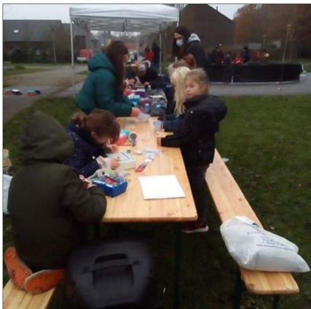
Buurtsport Brugge actief in Male