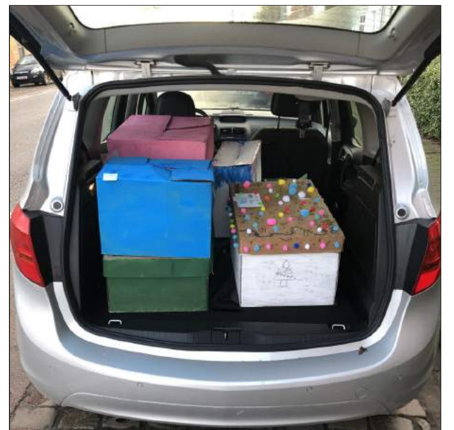
De Kantelkar wordt voor de tweede maal geladen met kerstgeschenken.