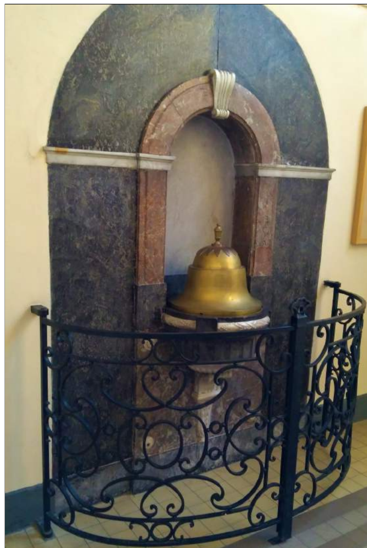
Smeedijzeren hekken Heilige Kruisverheffing