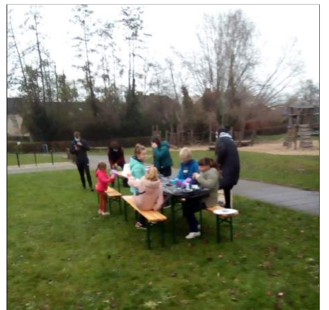
De jongeren genieten van hun vieruurtje.