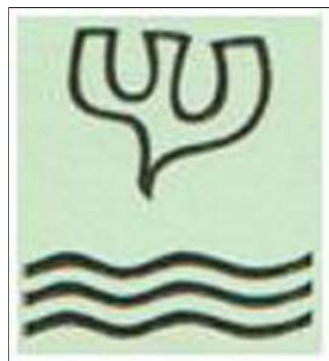
Detail symboolvloer Heilige Kruisverheffing

Jezus verliet het vertrouwde Nazareth, gelegen in het noordelijke Galilea, om zich in het zuiden te laten dopen. Na de onderdompeling daalde de Heilige Geest over Hem neer