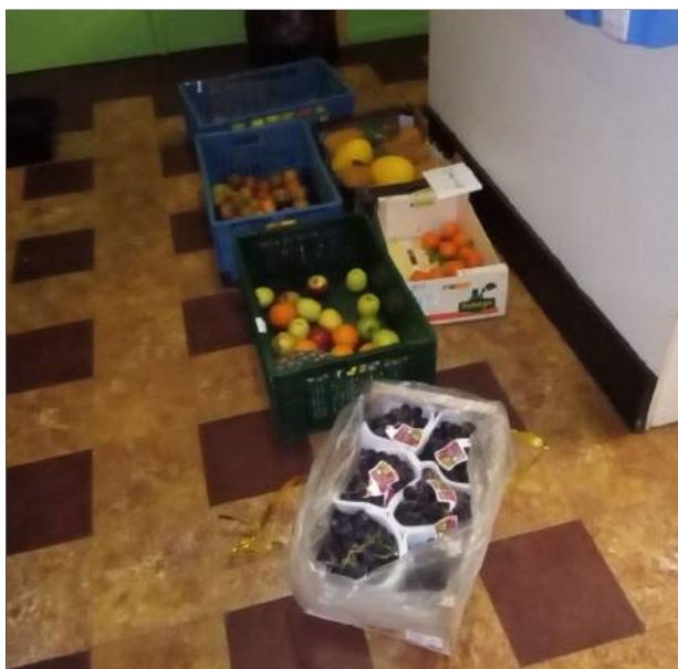
Gezonde snacks voor de jongeren.