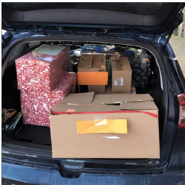
De Kantelkar wordt geladen met de kerstgeschenken.